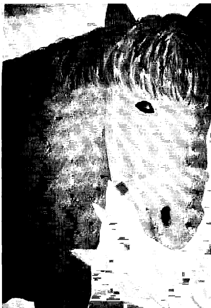
図 11. 2 年時