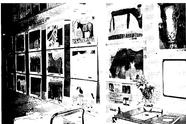
図6. 仁和中 馬の絵校内展