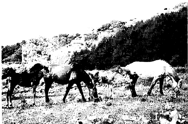
図2. 仁和の大地の馬たち