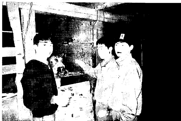
図3. 3年生スケッチ風景