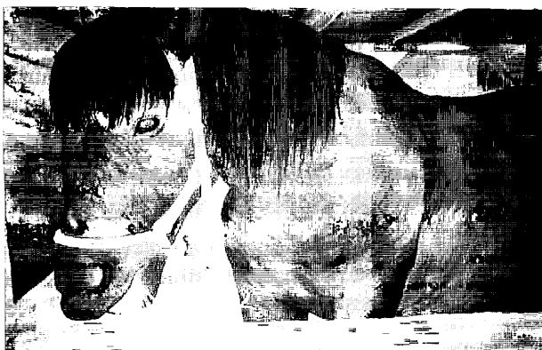
図 12. 3 年時 「第 4 回 馬の絵作品展」 入選