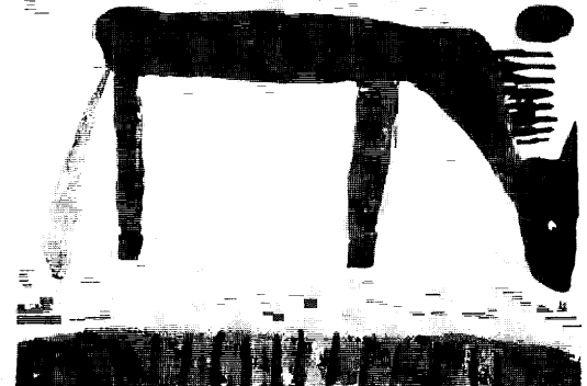
図 13. 1 年時