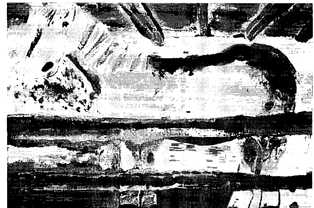
図 15. 3 年時